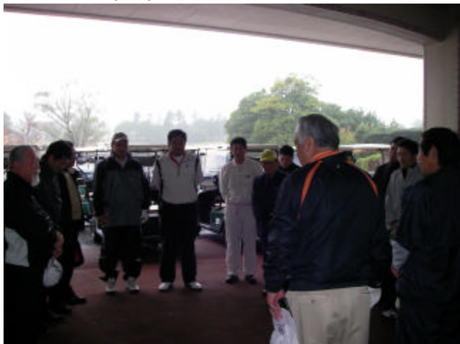
組合ゴルフコンペ